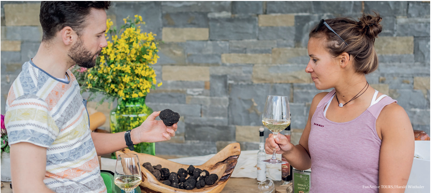
FunActive TOURS / Harald Wisthaler