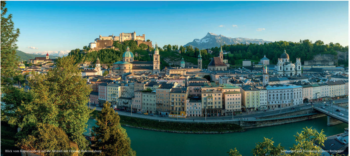
Blick vom Kapuzinerberg auf die Altstadt mit Festung Hohensalzburg